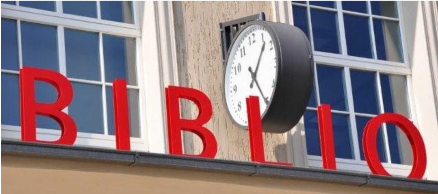
Luckenwalde, Bibliothek im Bahnhof.

Wir bitten alle Referenten und Fragesteller um Verständnis für unser zwangsläufig striktes Zeitmanagement!